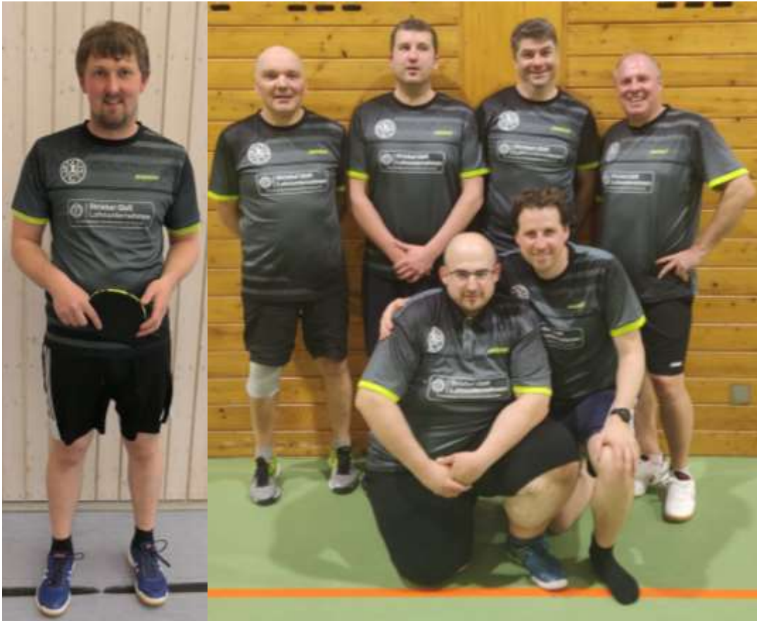
Team 1 in der Bezirksklasse