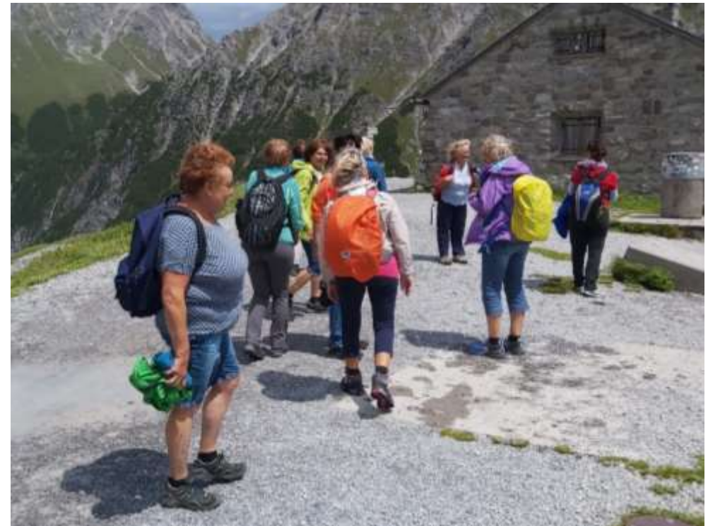
Ausflug an den Lünensee