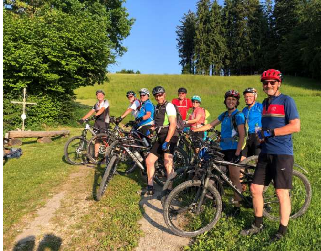
Auf einer Anhöhe bei Gschnait

Highlight war die Tour am 3.10.23 um den Rottachspeicher, über Oy zur Buronhütte und am Grüntensee vorbei zurück zum Rottachspeicher (43km und 950hm).